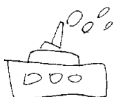
かりゆしまつゆめ

「絵はオニババのような快心の出来で満足するが、お姉さんに見せると明らかに怒っている。まあ、しかたがない。」